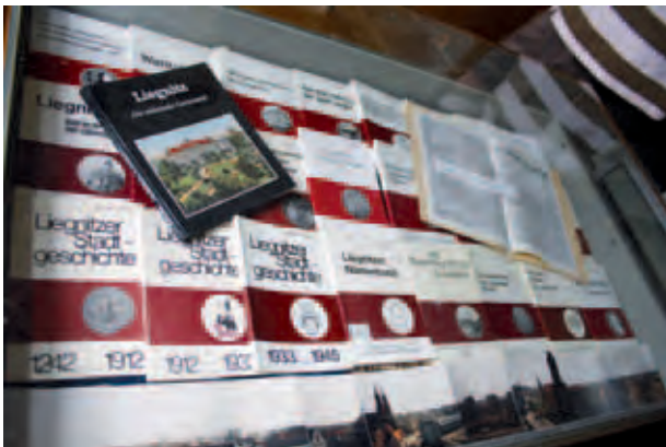
Die „Historische Gesellschaft Liegnitz“ gibt regelmäßig Publikationen zur Geschichte der Stadt bis 1945 heraus; Legnickie Towarzystwo Historyczne („Historische Gesellschaft Liegnitz“) regularnie wydaje publikacje o historii Liegnitz/Legnicy; „Историческое общество Лигниц“ регулярно издаёт публикации об истории города Лигниц/Легница; E. Szumanska, VII 2012, © Liegnitzer Sammlung Wuppertal