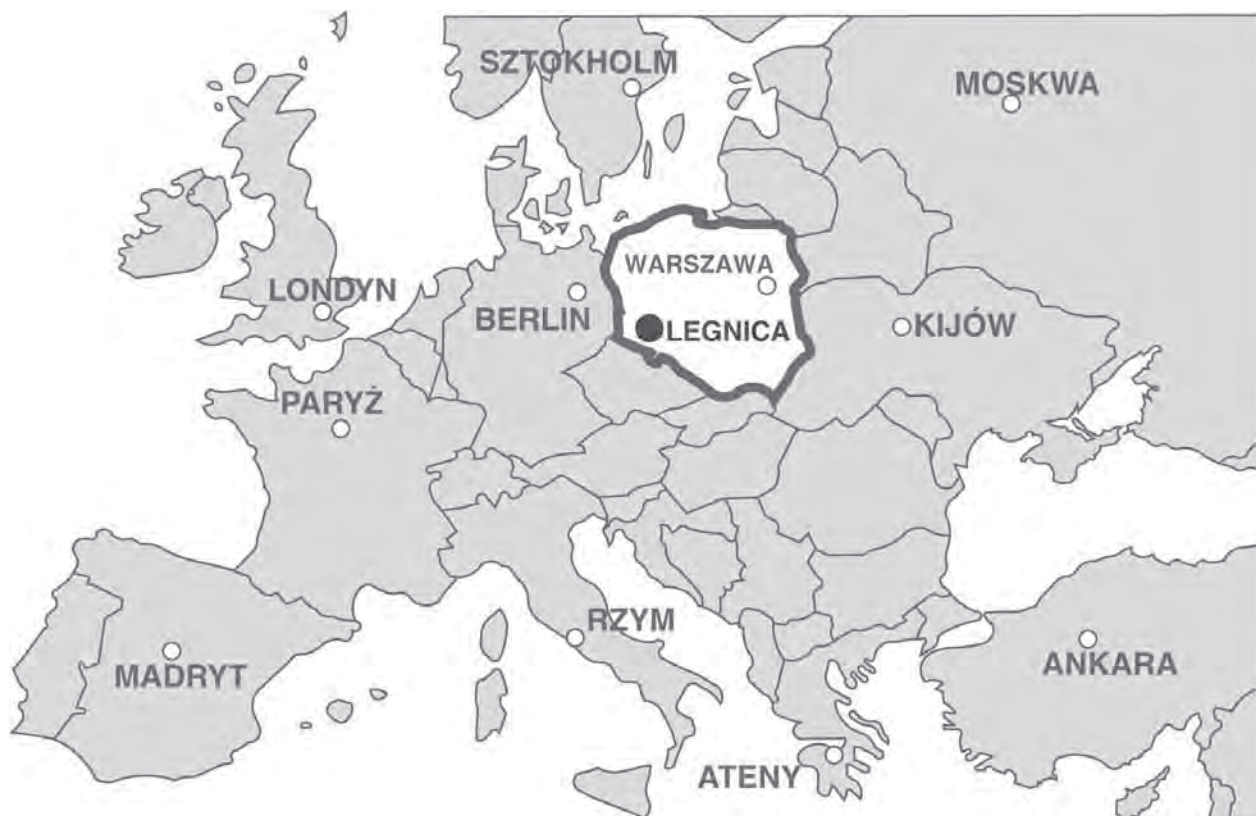
Die Lage Legnicas auf der Landkarte Polens; Lokalizacja Legnicy na mapie Polski; Определение местоположения города Легница на географической карте Польши