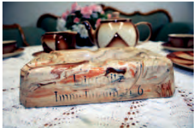
In der „Liegnitzer Sammlung“ findet man unter anderem antike Möbel, Kaffeervices, Aschenbecher...; W Wuppertalu obejrzeć można zabytkowe meble, zastawę stołową, popielniczkę...; В „Лигницкой коллекции“ мы смогли полюбоваться античной мебелью, кофейным сервисом, пепельницей; E. Szumanska, VII 2012, © Liegnitzer Sammlung Wuppertal