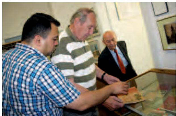
Im Rahmen unserer Reise nach Wuppertal konnten wir nicht nur die Liegnitzer Sammlung besichtigen, sondern vor allem auch interessante Gespräche führen; Wyjazd do Wuppertalu to nie tylko obejrzenie zbiorów, lecz przede wszystkim ciekawe rozmowy; Наша краткосрочная поездка в Вупперталь состояла не только из посещения музейной коллекции, но и в первую очередь, из интересных бесед; E. Szumanska, VII 2012, © Liegnitzer Sammlung Wuppertal