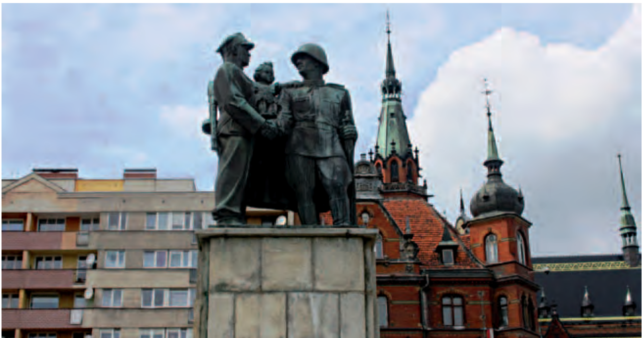
Triumph der Brüderlichkeit – „Denkmal der Dankbarkeit für die Sowjetische Armee“. Auf dem Sockel sind ein polnischer und ein sowjetischer Soldat, der ein kleines Mädchen auf dem Arm hält, zu sehen. Die allgemeine Einteilung der Einwohner von Legnica in Polen und Sowjets ist keineswegs vereinfacht. Man darf dabei aber die deutschen Einwohner und die Tatsache, dass sich unter den Sowjets Vertreter vieler Nationen befanden, nicht vergessen. In den Nachkriegsjahren lebten in Legnica außerdem Griechen, Bulgaren, Zigeuner u.a. Es gibt leider keine zuverlässigen historischen Quellen darüber, wie diese Koexistenz ausgesehen hatte; Tryumf braterstwa. Pomnik Wdzięczności dla Armii Radzieckiej. Na cokole polski i rosyjski żołnierz trzymający na ręku małą dziewczynkę. Powszechny podział mieszkańców Legnicy na Polaków i Rosjan jest bynajmniej uproszczony. Nie należy zapominać nie tylko o Niemcach oraz o tym, że pod pojęciem Rosjan mamy na myśli wiele narodów tworzącego sowieckiego państwa, ale także o obecnych w Legnicy w powojennych latach Greków, Bułgarów, Cyganów, Żydów i innych. Nie istnieją niestety rzetelne źródła historyczne na temat, jak układała się ta koegzystencja; Триумф братства. Памятник Благодарности Красной Армии. На постаменте польский и советский солдаты держат на руках маленькую девочку. Деление населения Лезницы только на поляков и русских очень упрощено. Нельзя забывать не только о немцах, греках, болгарях, цыганах, евреях, проживающих в Лезнице до войны и сейчас, но и том, что под понятием русские, мы имеем в виду многие народы советского государства. К сожалению, серьезные исторические источники на тему их сосуществования, не существуют.; E. Szumańska, V 2012