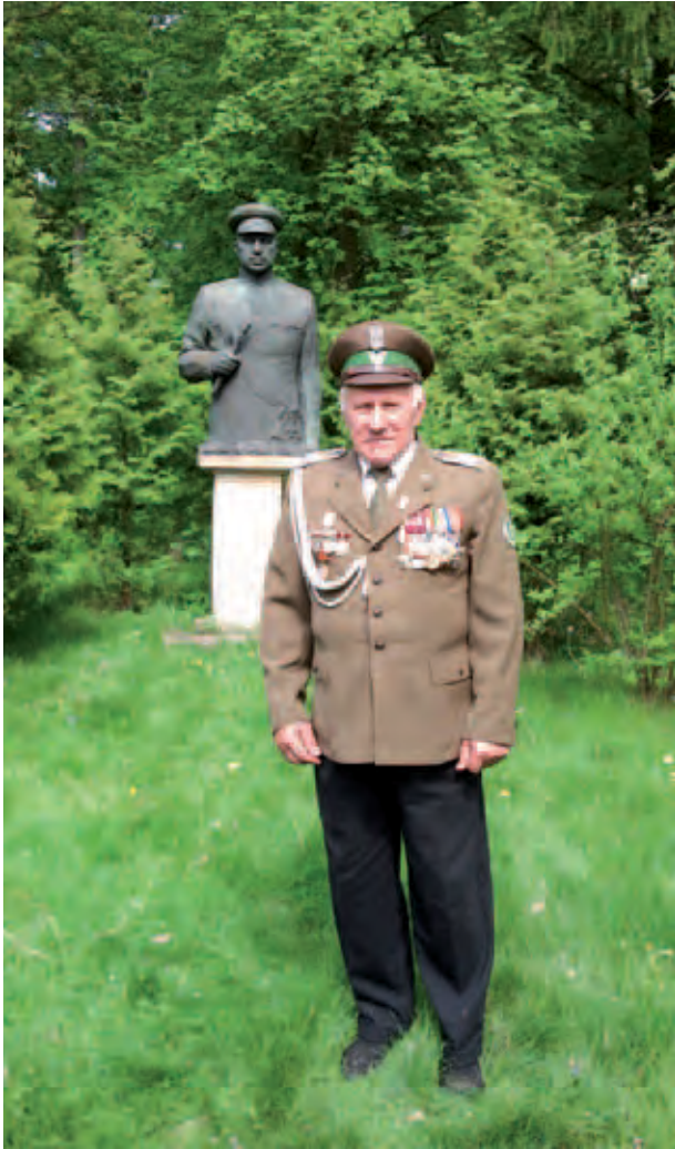
Denkmal für einen Helden der Sowjetunion – Marschall Konstantin Konstantinowitsch Rokossowski im Garten von Michał Sabadach; Pomnik wielkiego bohatera Związku Radzieckiego, marszałka Konstantego Konstantynowicza Rokossowskiego, w sadzie Michała Sabadacha; Памятник Дважды Герою Советского Союза, Маршалу Советского Союза Константину Константиновичу Рокоссовскому; A. Alimurzaev, V 2012