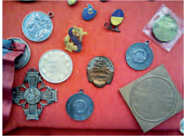
Deutsche Abzeichen aus Liegnitz; Niemieckie odznaczenia z Liegnitz; Немецкие отличия из города Лигниц; A. Alimurzaev, VII 2012, © Liegnitzer Sammlung Wuppertal