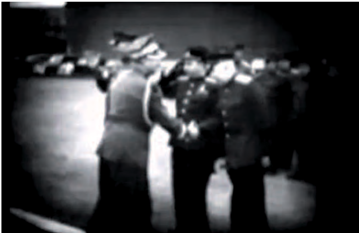
Polnische Offizielle begrüßen die sowjetische Delegation.; Przedstawiciele polskiej administracji witają radziecką delegację; Польские офицеры, приветствуют советскую делегацию; Kadr z filmu: Legnica 1945 r., http://www.youtube.com/watch?v=KQSI2RbKxcQ