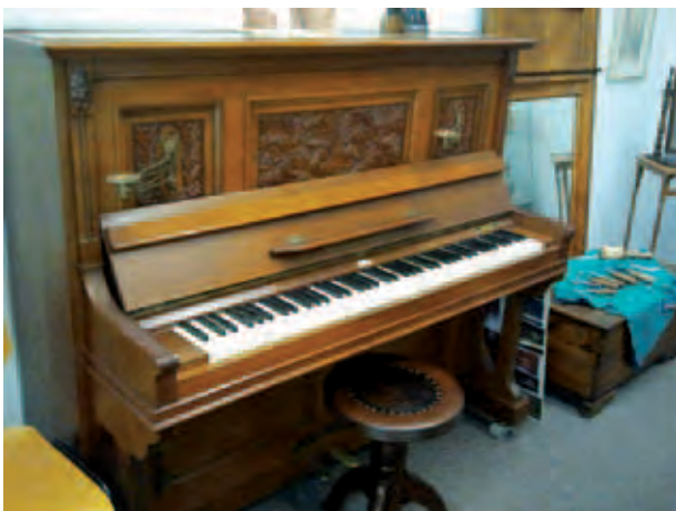
...und sogar ein Klavier!; ...a nawet pianino z Liegnitz; ... и даже пианином из города Лигниц; A. Alimurzaev, VII 2012, © Liegnitzer Sammlung Wuppertal