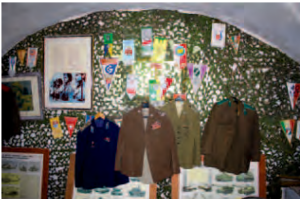
Exponate im Museum von Michał Sabadach; Ekspozycje w Muzeum Sabadacha; Музейные экспонаты Михала Сабадаха; M. König, V 2012