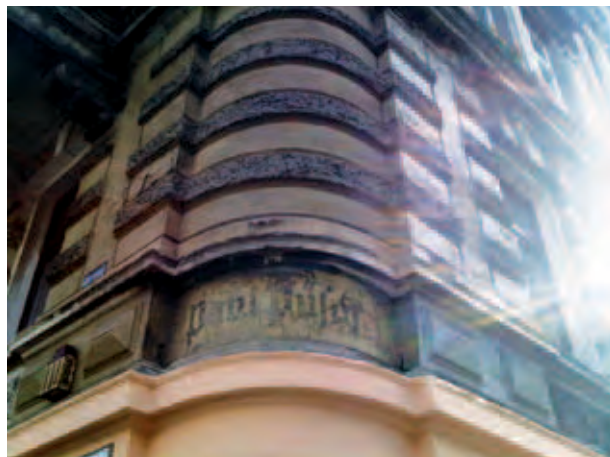
Erhalten gebliebene deutsche Spuren in der ulica Piastowska in Legnica; Zachowane niemieckie ślady na ulicy Piastowskiej w Legnicy; Сохранить оставшиеся немецкие следы по улице Пиастовская (ulica Piastowska) в городе Легница; M. König, X 2012