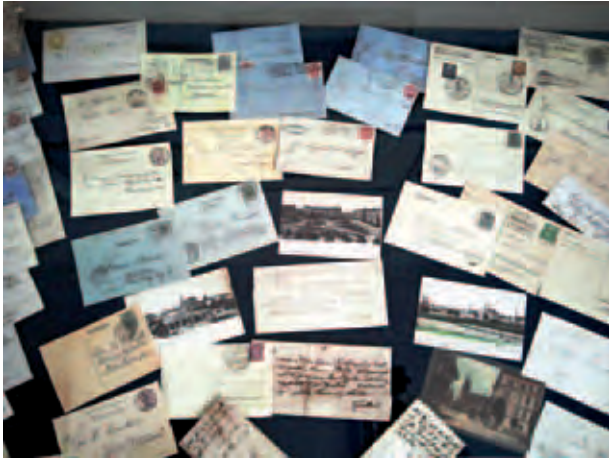
Sammlung deutscher Postkarten; Kolekcja niemieckich pocztówek; Коллекция немецких почтовых марок; A. Alimurzaev, VII 2012, © Liegnitzer Sammlung Wuppertal