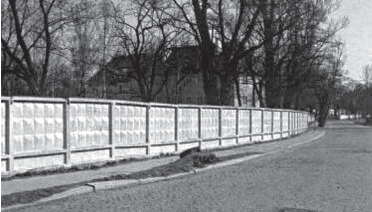
Ein Teil der Mauer, die das Viertel „Quadrat“ vom Rest der Stadt getrennt hat; Fragment muru oddzielającego Kwadrat od pozostałej części miasta; Фрагмент стены, которая отделяла „Квадрат“ от остальной части города; http://www.poradzieckie.szprotawa.org.pl/legnica_kwadrat.html ;