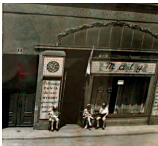
Erste polnische Geschäfte werden eröffnet; Otworzono pierwsze polskie sklepy; Открываются первые польские магазины; M. König, V 2012