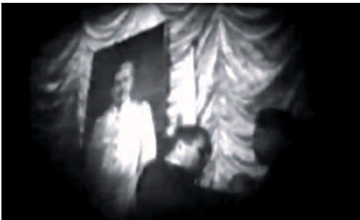
Ehrung der Helden unter den Augen Stalins.; Odznaczenie wyzwolicieli Legnicy pod okiem Stalina; Чествование героев перед глазами Сталина; Kadr z filmu: Legnica 1945 r., http://www.youtube.com/watch?v=KQSI2RbKxcQ