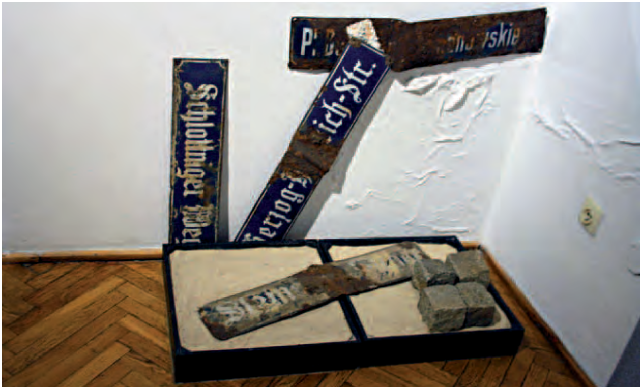
Deutsche Straßenschilder werden von nun an durch polnische Schilder ersetzt. Exponate aus dem Muzeum Miedzi Legnica.; Niemieckie nazwy ulic zostały narychmiast zastąpione szyldami w języku polskim. Eksponaty w legnickim Muzeum Miedzi; С этого момента, немецкие таблички с названиями улиц, ужеменяются на польские. Экспонаты из Музея меди города Лезница.; М. König, V 2012