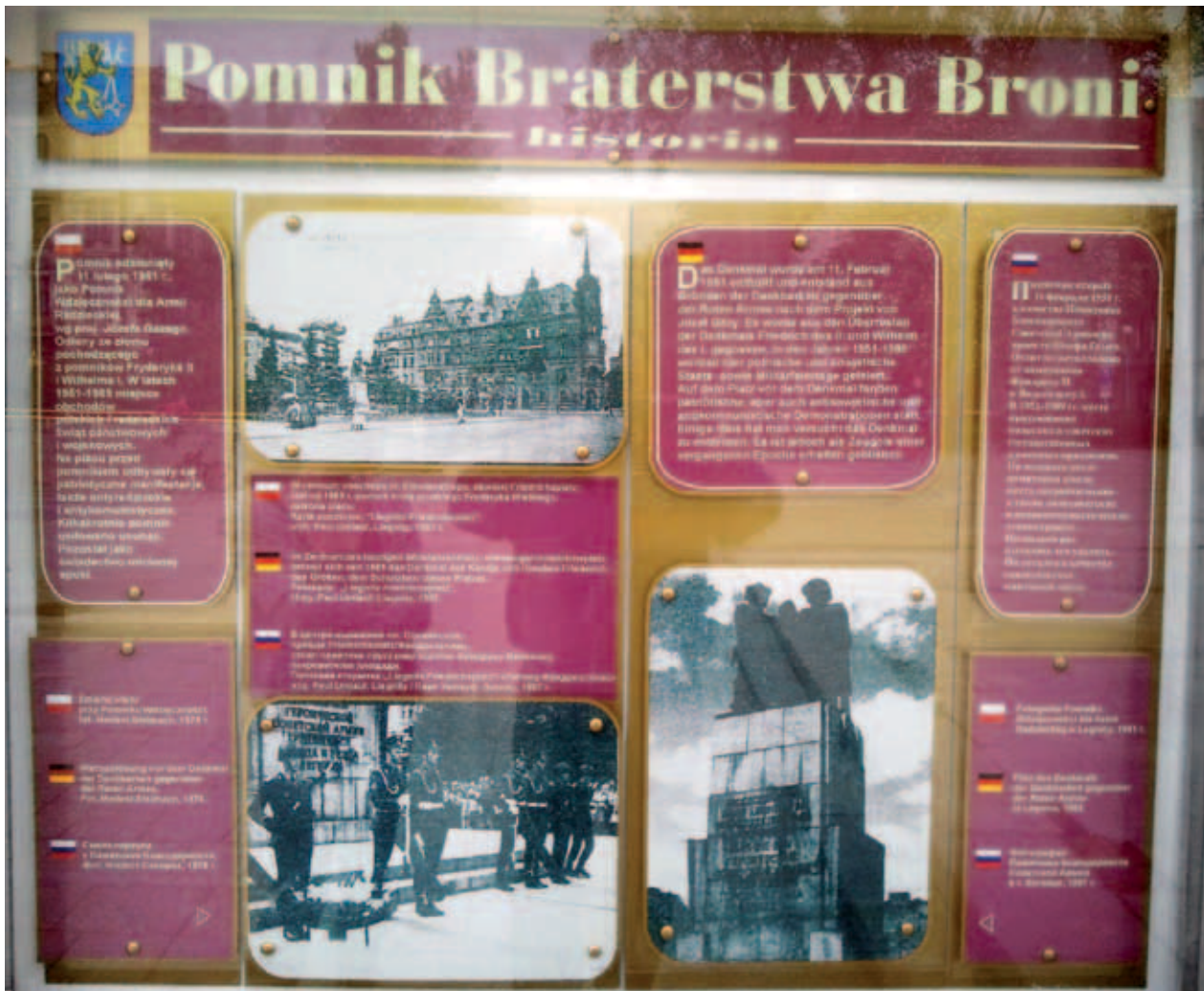
Informationstafel am „Denkmal der Dankbarkeit für die Sowjetische Armee“; Tablica informacyjna przy Pomniku Wdzięczności; Информационная доска, расположенная рядом с Памятником Благодарности; A. Alimurzaev, V 2012