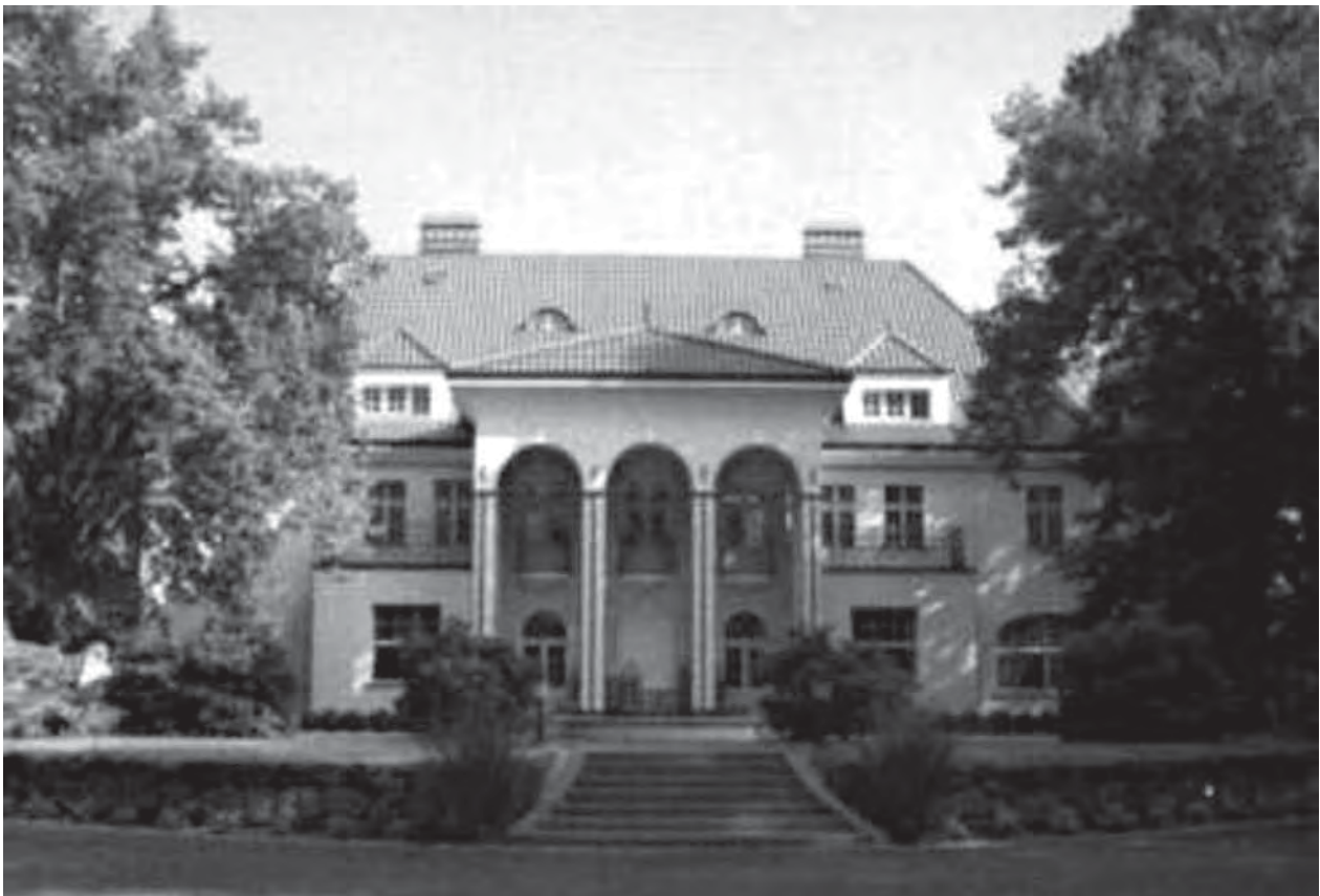
Das sogenannte „Dom Prijoma“ (Haus des Empfangs). Insgesamt übernahm die sowjetische Armee etwa 1.200 verschiedene Objekte ausschließlich zur eigenen Verfügung. Dies entspricht ca. 30% der Vorkriegsbausubstanz der Stadt; Tzw. Dom Prijoma. Ogółem wojska radzieckie przejęły do swojej wyłącznej dyspozycji ok. 1200 różnych obiektów, co odpowiada 30% przedwojennej zabudowy miasta; Так называемый „Дом приёма“. В общей сложности, Советская Армия переняла в своё исключительное пользование, примерно 1200 различных объектов, что составило приблизительно 30% всего довоенного жилищно-строительного комплекса города; http://www.poradzieckie.szprotawa.org.pl/legnica_kwadrat.html ;