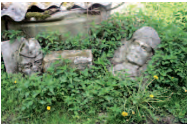
Teile des „Denkmals zur Erinnerung an den Warschauer Pakt“, gefunden auf dem ehemaligen sowjetischen Flugplatz; Elementy pomnika, postawionego na pamiątkę Układu Warszawskiego, przywiezione z byłego radzieckiego lotniska; Элементы памятника с бывшего советского военного аэродрома, посвящённого Варшавскому договору; E. Szumanska, V 2012