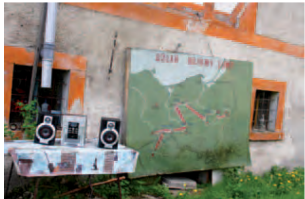
Truppenbewegungen der Zweiten Polnischen Armee – eine Tafel an der Wand des Hauses von Sabadach in Uniejowice; Szlak bojowy Drugiej Armii Wojska Polskiego, na ścianie domu Sabadacha w Uniejowicach; Путь военного продвижения Второй Польской Армии, изображение которого размещено на стене дома-музея Михала Сабадаха в селении Унёвицы; E. Szumanska, V 2012