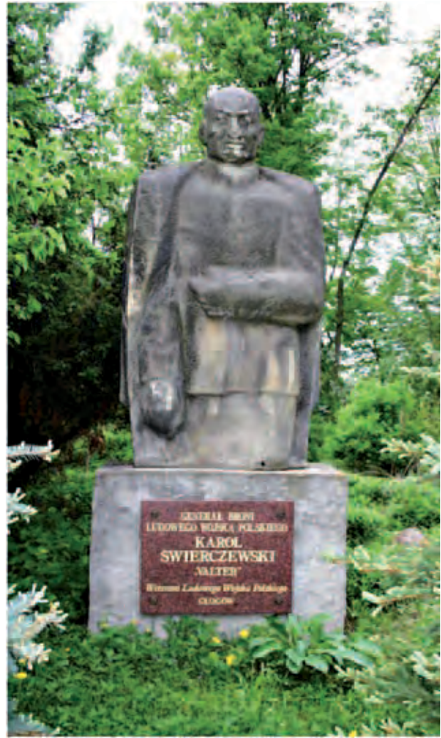
Denkmal für Karol Świerczewski – Waffengeneral der 2. Polnischen Armee; Pomnik Generała Broni Wojska Polskiego Karola Świerczewskiego; Памятник Генералу Брони Войска Польского Карольови Свєрчевскому; A. Alimurzaev, V 2012