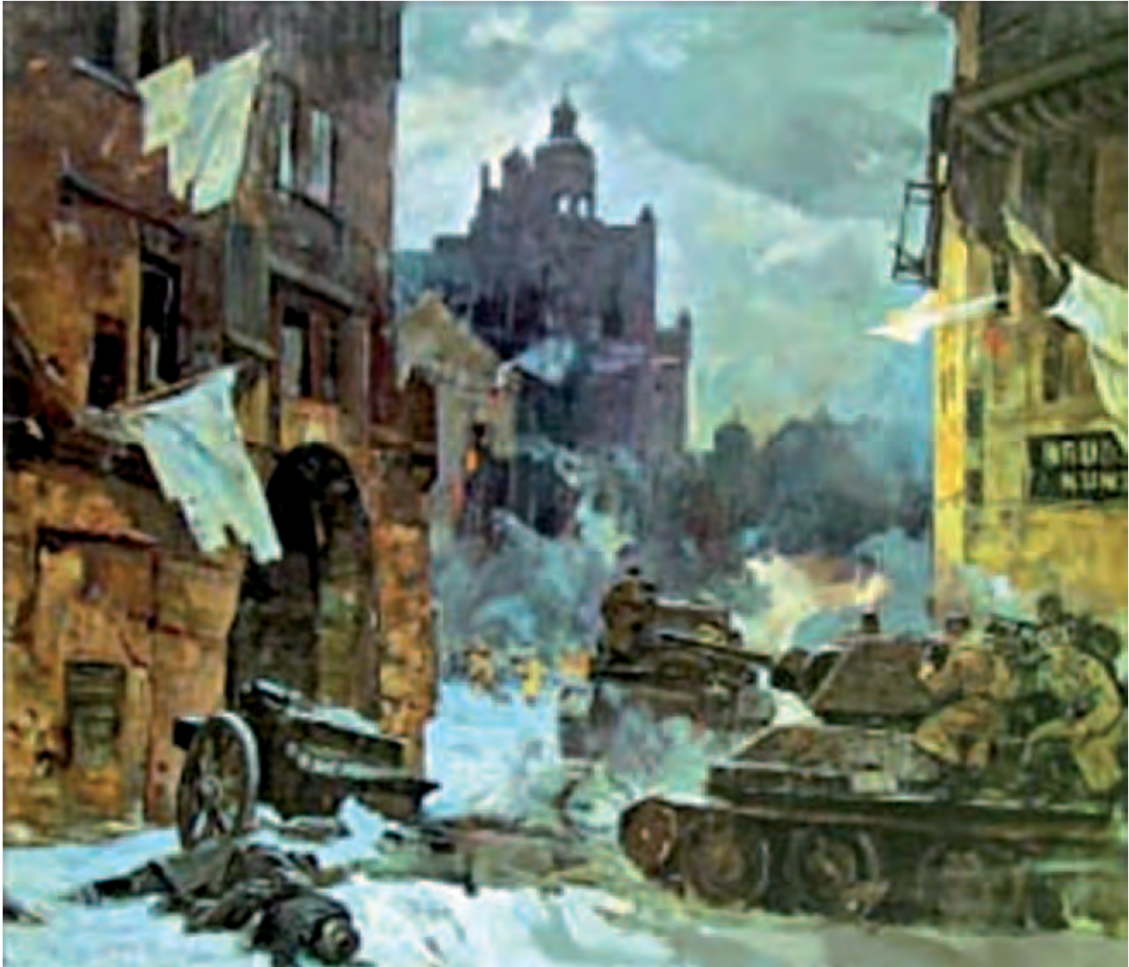
F. Usypenko, 1945: „Befreiung”. Die Rote Armee befreit Liegnitz; F. Usypenko, 1945 r.: „Oswobodzenie”. Armia Czerwona uwalnia Legnicę; Ф. Усыпенко, 1945 год: «Освобождение. Красная армия освобождает Лезницу»; http://www.allworldwars.com/Soviet-War-Paintings-Part-II.html