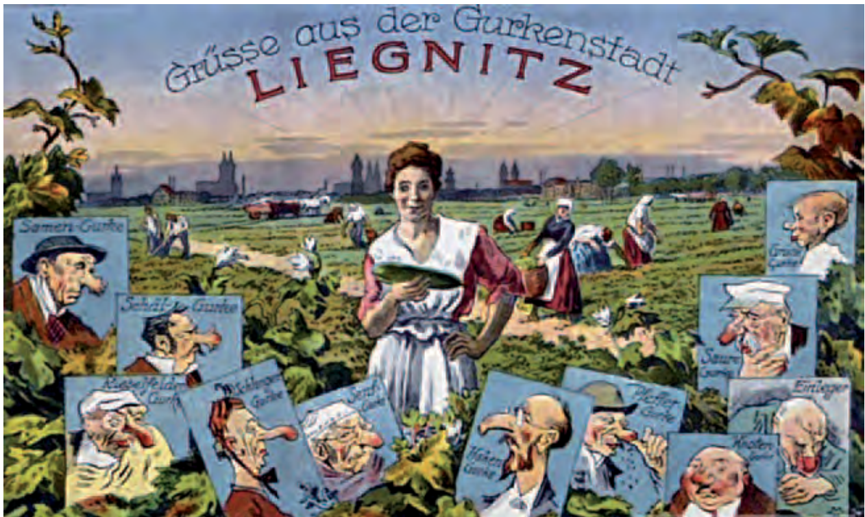
Im ganzen Deutschen Reich war Liegnitz für seine Gurken bekannt.; W Rzeszy Legnica była znana głównie dzięki uprawom ogórków; Повсюду, в Германской империи, город Лигниц, был известен своими огурцами; © RKH Schutzmarke, Lgtz. 891. Rübezahl-Druckerei und Verlag Paul Höckendorf, Hirschberg i. Schl.