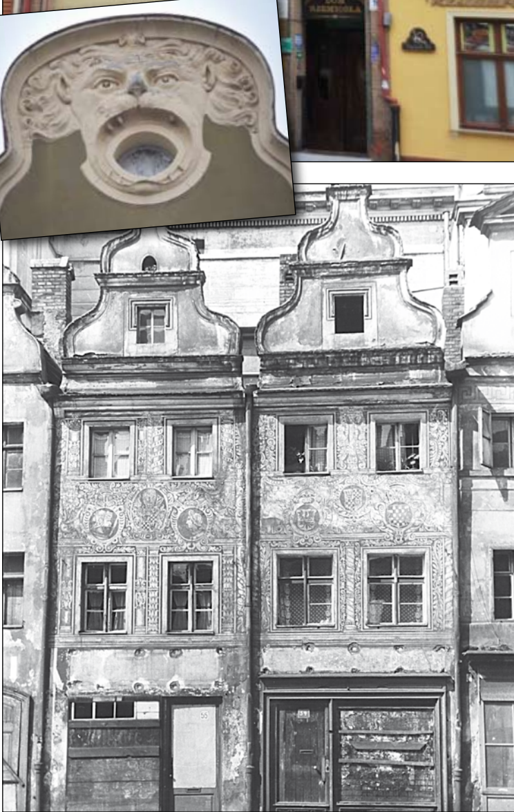
Do lat 60. XX wieku w parterze śledziówek mieściły się sklepy i zakłady. Dopiero wówczas przyziemiu nadano arkadowe podcienia.

Legnicki Rynek jest jednym z największych w Polsce. Spośród innych wyróżniają go okazałe i unikatowe zabytki architektury, ale też szpetne betonowe reliktory peerelu. Mimo szkaradnego sąsiedztwa bloków, rynkowe perełki cieszą oko turystów, a mieszkańcom dają powody do dumy.