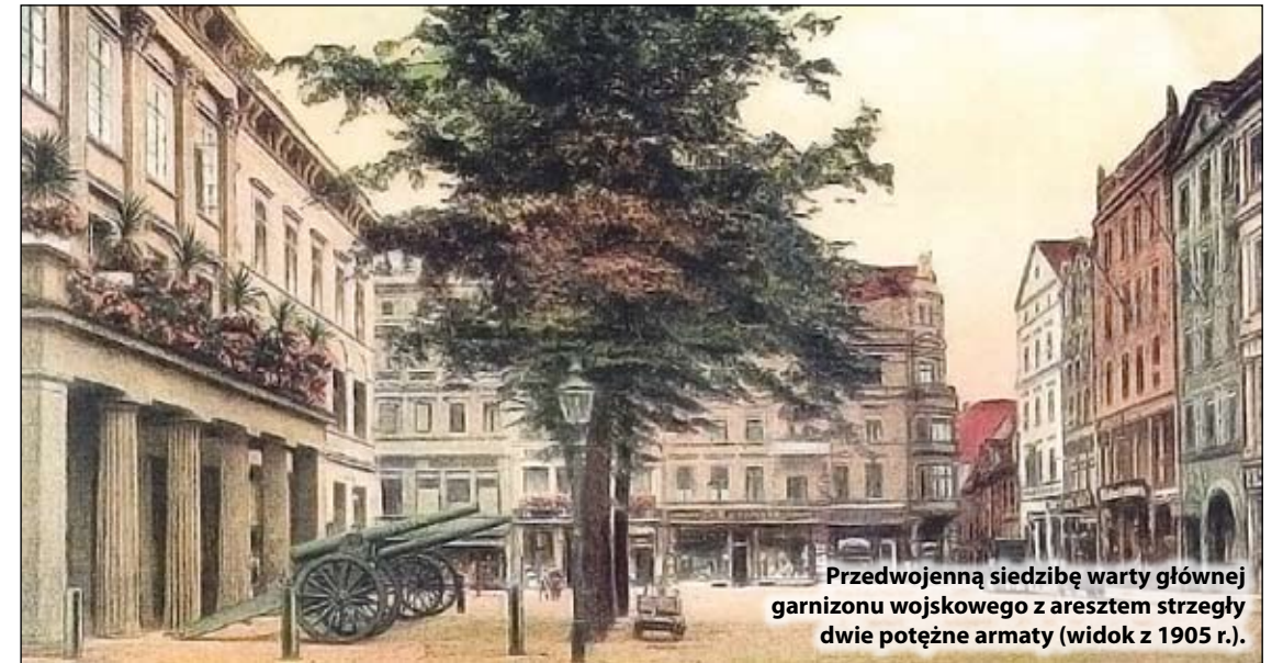
Przedwojenną siedzibę warty głównej garnizonu wojskowego z aresztem strzegli dwie potężne armaty (widok z 1905 r.).

Sgraffito zachowało się w dobrym stanie dzięki tynkowi, który przez ponad sto lat zasłaniał i ochraniał dekorację odkrytą dopiero w 1909 r. (po wojnie elewację kilkakrotnie poddawano renowacji). Niewiele brakowało, a cenny budynek podzieliłby los podobnych obiektów zrównanych z ziemią w latach 50. i 60. W czasie budowy sąsiednich bloków w 1967 r. kamieniczka groziła zawaleniem i tylko dzięki stanowczości i nieustępliwości wrocławskich służb konserwatorskich do tego nie doszło. Istnieje wielkie prawdopodobieństwo, że w renesansowej Legnicy było znacznie więcej sgraffitowych dekoracji, które pod warstwą tynku przetrwały aż do polsko-radzieckich czasów Legnicy, kiedy powaliły je buldożery.