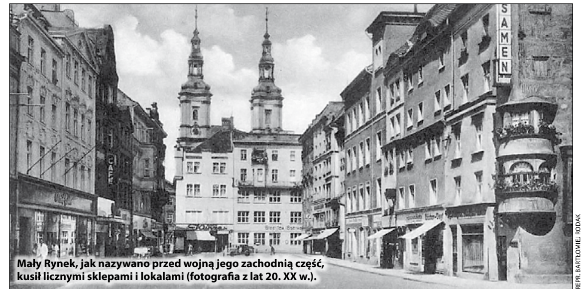
Mały Rynek, jak nazywano przed wojną jego zachodnią część, kuśił licznymi sklepami i lokalami (fotografia z lat 20. XX w.).